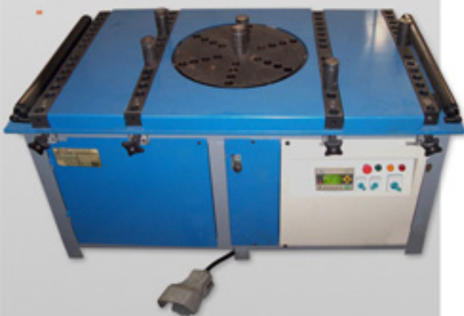
GBT - 50 Maquina dobladora