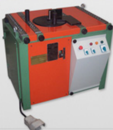
GBTD - 50 Maquina dobladora