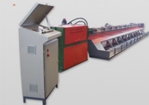
HBM-280 Maquina de enrosque de malla metalica