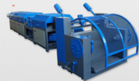
GTCHE-12 Sistema de estirado de hilo metalico( sistema «dancer» )