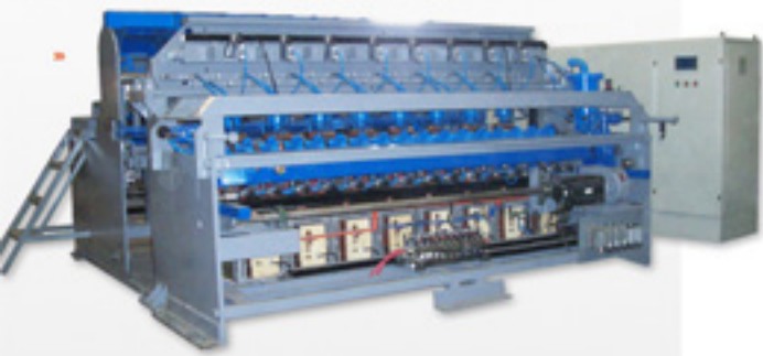
HK-2400 Soldador de malla metalica